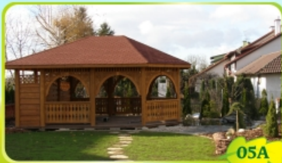
6,5m x 4m