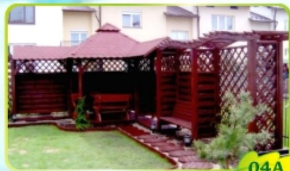
6m x 4m