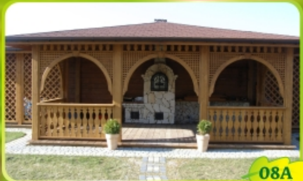
7m x 5m