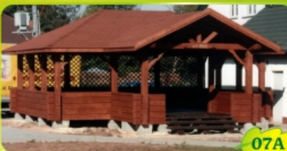
8m x 6m + ganek 4m x 2,5m