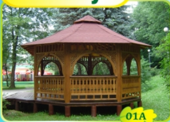
8m x 5m